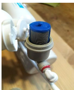
...à ras bord = 20ml