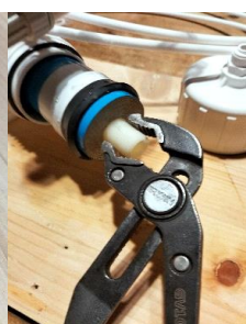
Pince à tête réglable