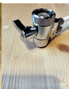
avec son mousseur